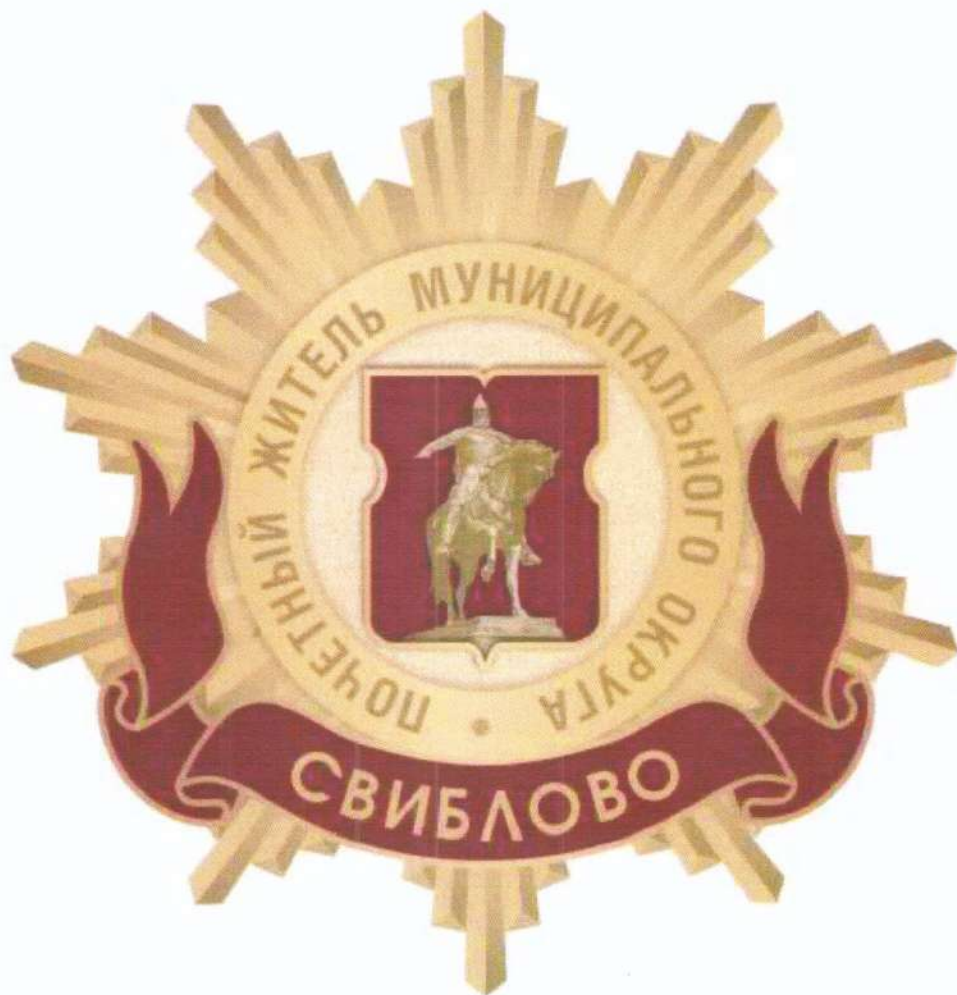
Рисунок нагрудного знака к званию «Почетный житель внутригородского муниципального образования – муниципального округа Свиблово в городе Москве»

Приложение 3 к решению Совета депутатов внутригородского муниципального образования – муниципального округа Свиблово в городе Москве от 19 февраля 2025 года № 3/1