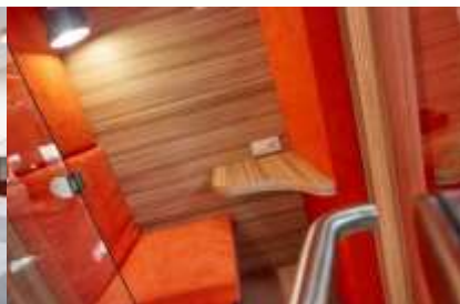
Комфортная зона ожидания