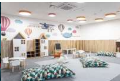
Просторный детский уголок