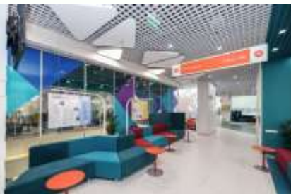
Большая площадь помещения