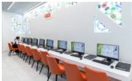
Расширенная зона электронных услуг