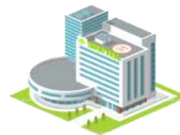
ГОЛОВНОЕ УЧРЕЖДЕНИЕ ул. Декабристов, 24